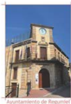
Ayuntamiento de Regumiel