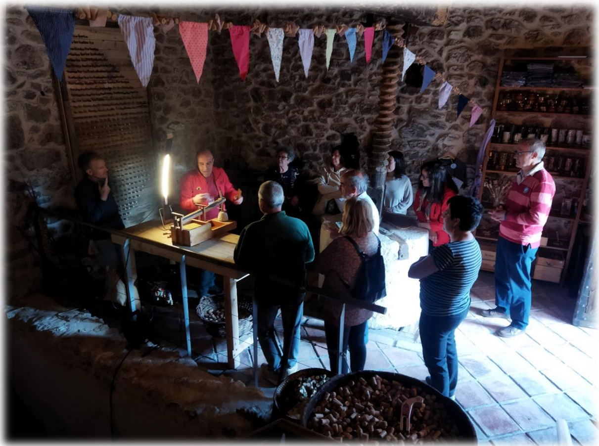
Foto: Lagar Museo del Corcho (Fuentelisendo) 24/04/2023. ADRI RDB.

Torregalindo: su fortaleza y arquitectura tradicional.