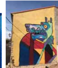
10. Título: Lobo" Esperanza. Autor: Marcos Arrabal.