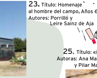
23. Título: Homenaje al hombre del campo. Años 60 Autores: Porrilló y Leire Sainz de Aja