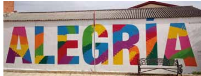
15. Título: La alegría. "Acogida de todas las persona" Autor: Lucas Abajo y Laxmi Nazabal