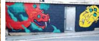
20. Título: Reciclando, del Aceite al Jabón. Autor: Miguel del Cura