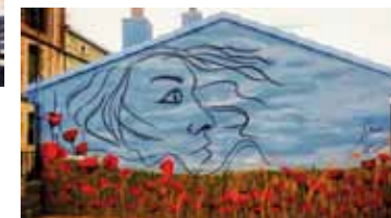
14. Título: Aires rurales. "Mujer rural" Autor: : Ana Manso y Pilar Manso.