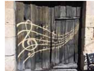
9. Título: After... "La Música" Autor: Pilar Manso