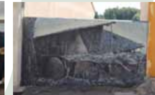
19. Título: Algo hubo aquí. Tradiciones chimenea Autor: Porrilló