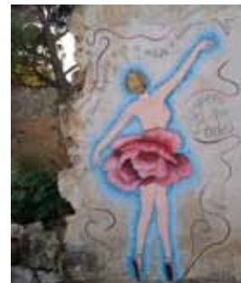
6. Título: Espero que bailes. "Movimiento" Autor: María Manso