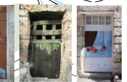
17. Título: Manzanas de mi huerta. Autor: Azucena Pérez