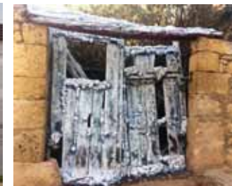
8. Título: Nevada perpetua. "Cambio climático" Autor: Porrilló