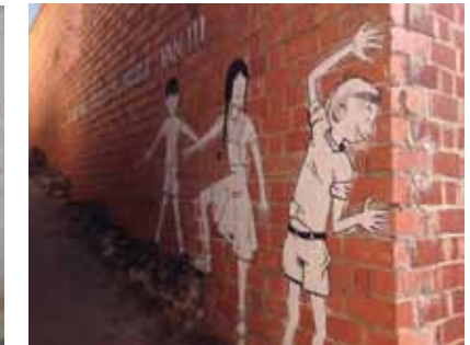
7. Título: Juego de niños. "Juegos tradicionales" Autor: Miguel Gutiérrez